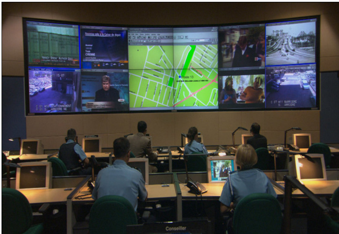
Figura 04. Mostra um exemplo de monitoramento usado pela Polícia Militar do Estado de São Paulo.

O monitoramento é muito importante no planejamento, na implementação e operação do projeto. É como ver o local onde irá andar de bicicleta, você pode ir ajustando a direção ao longo do caminho, garantindo que está no caminho certo. Como na figura abaixo.