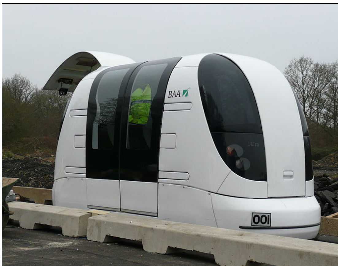
Figura 01. Um exemplar de TRP.

Desenvolvido pela Pininfarina em parceria com a Vectus, empresa coreana especializada em desenvolver soluções de mobilidade urbana. E o veículo pode melhorar a mobilidade nas cidades, e se integrar perfeitamente a elas. O TRP é composto quase integralmente por janelas, adornadas por uma estrutura de fibra de carbono que pode ser customizada de acordo com o ambiente. Na figura abaixo, um veículo TRP.